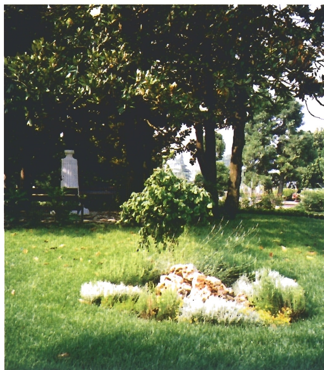
Il giardino del ricordo al Cimitero di Lambrate